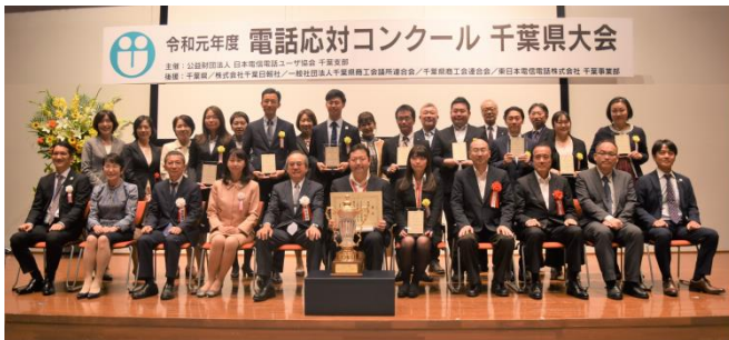
2019年10月17日 於mBAY POINT幕張