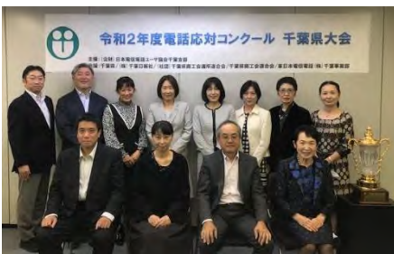
審査会場 於幕張テクノガーデン