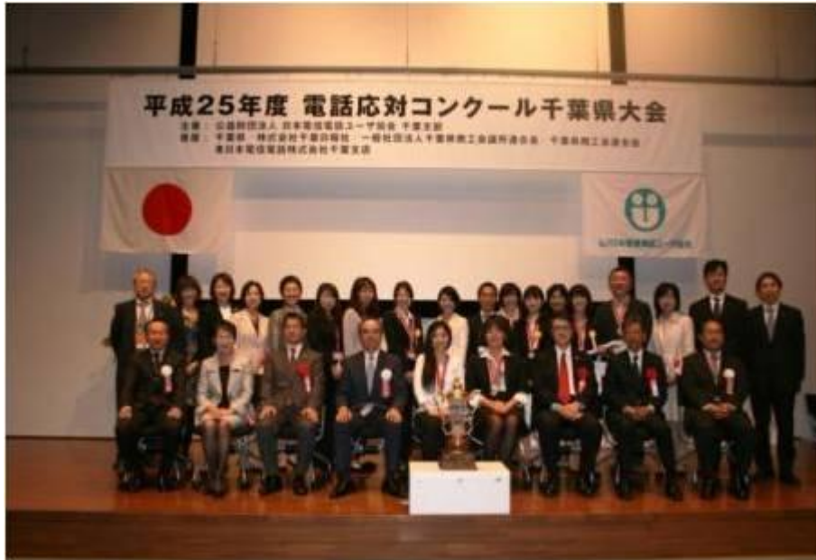
平成25年10月18日 於:NTT幕張ビル 第一プレゼンテーションルーム