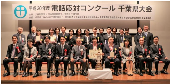
2018年10月18日 於 m BAY POINT 幕張