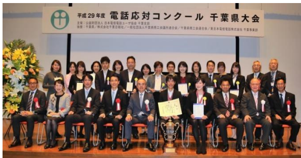
平成29年10月19日 於エム・ベイポイント幕張