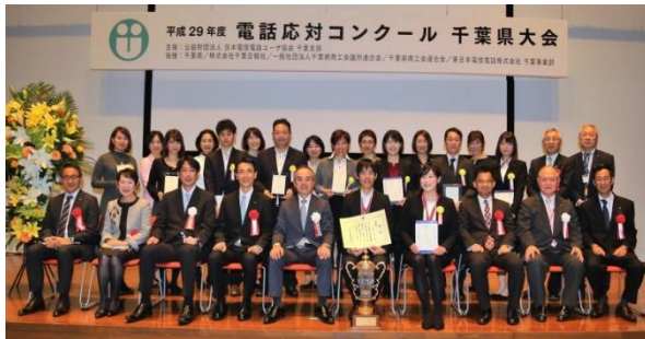
平成29年10月19日 於エム・ベイポイント幕張