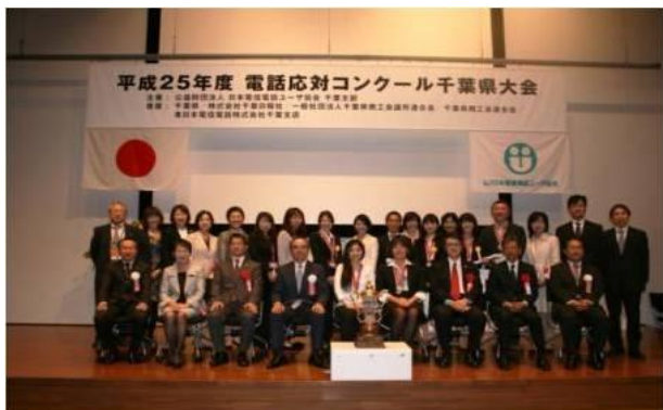
平成25年10月18日 於：NTT幕張ビル 第一フレイションホール