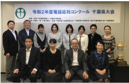
審査会場 於幕張テクノガーデン