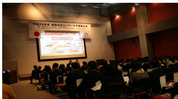
平成25年10月18日 於：NTT幕張ビル 第一プレゼンテーションルーム