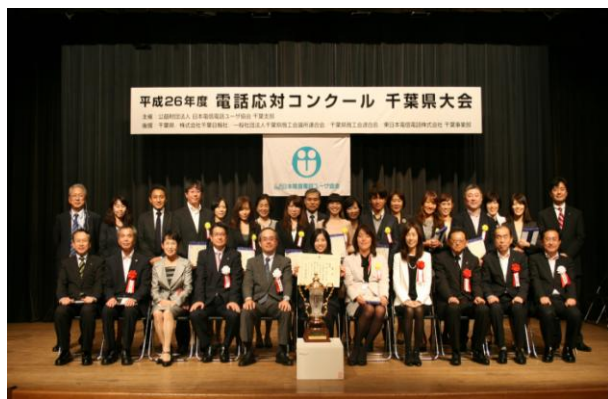
平成26年10月9日 於千葉県文化会館小ホール