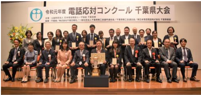
2019年10月17日 於mBAY POINT幕張