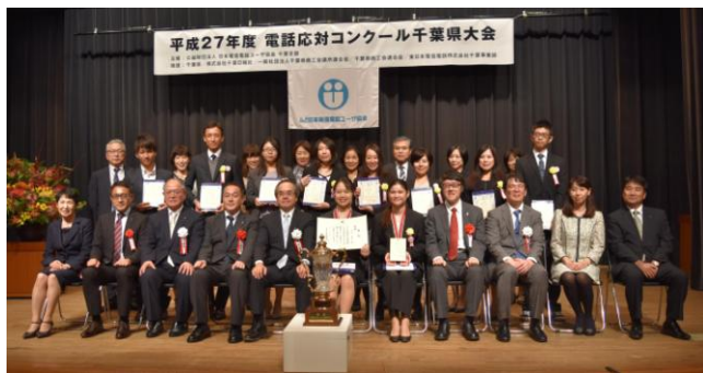
平成27年10月22日 於千葉県文化会館小ホール