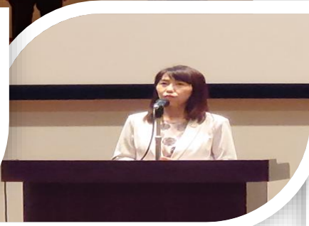
大会顧問 NTT東日本千葉事業部 境事業部長